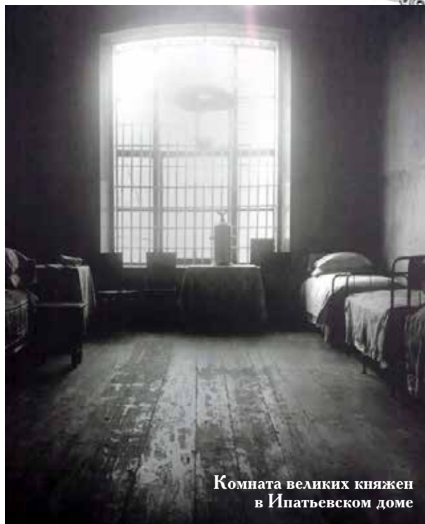
Комната великих княжен в Ипатьевском доме

— Что можно ответить на такое заявление: