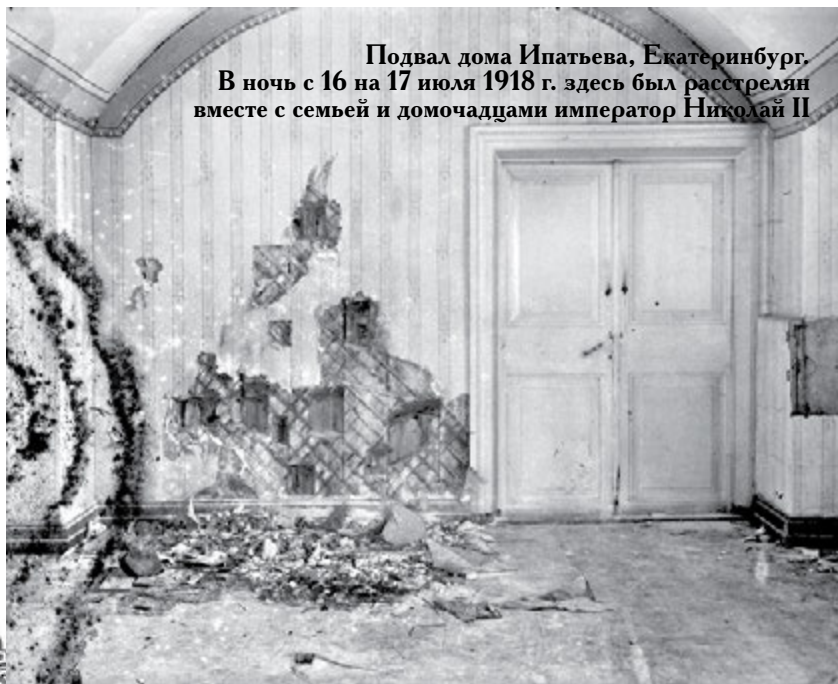
Подвал дома Ипатьева, Екатеринбург. В ночь с 16 на 17 июля 1918 г. здесь был расстрелян вместе с семьей и домочадцами император Николай II

Думаю, если отнестись со вниманием, серьезно, то нельзя не почувствовать, не увидеть величие этого подвига и не быть очарованным этими чудными образами — государя, государыни и их детей. Их жизнь была полна трудностей, скорбей, но была прекрасна! В какой строго-