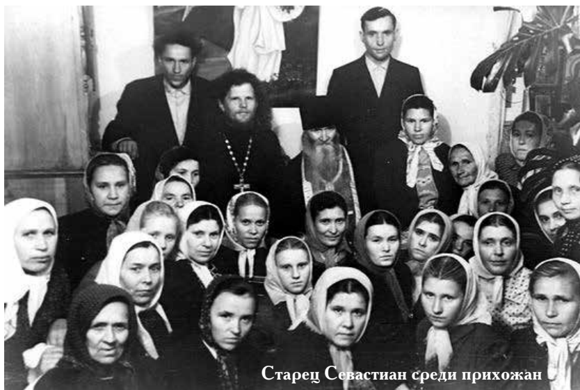
Старец Севастиан среди прихожан