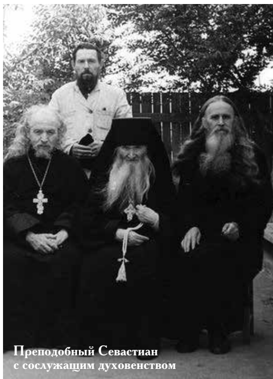
Преподобный Севастиан с сослужащим духовенством