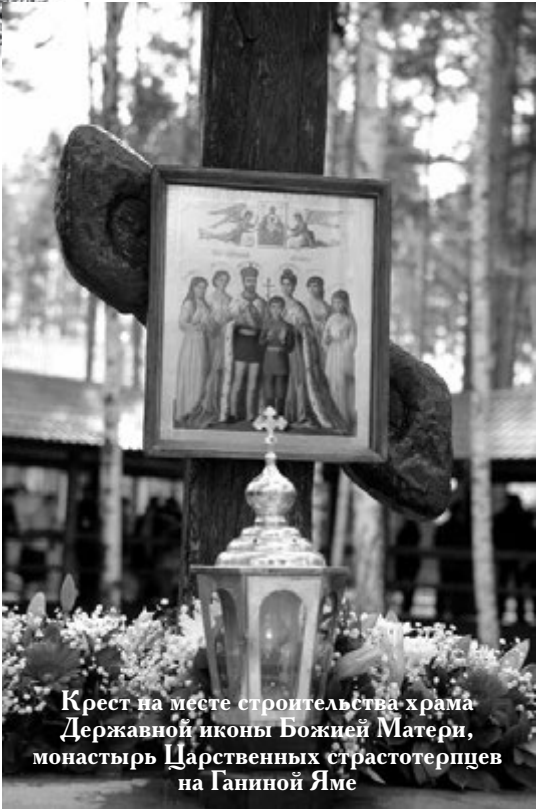
Крест на месте строительства храма Державной иконы Божией Матери, монастырь Царственных страстотерпцев на Ганиной Яме

сти воспитывались дети, как они все умели трудиться! Как не любоваться поразительной духовной чистотой великих княжон! Современным молодым людям нужно увидеть жизнь этих царевен, столь они были просты, величественны и прекрасны. За одно только целомудрие можно было их уже канонизировать, за их кротость, скромность, готовность служить, за их любвеобильные сердца и милосердие. Они ведь были очень скромными людьми, непритязательными, никогда не стремились к славе, жили так, как их Бог поставил, в тех условиях, в которые они были поставлены. И во всем отличались удивительной скромностью, послушанием. Никто никогда не слышал, чтобы они проявляли какие-либо страстные черты характера. Наоборот, в них было возвращено христианское устройство сердца — мирное, целомудренное. Достаточно даже просто посмотреть фотографии царской семьи, они сами по себе уже являют удивительный внутренний облик — и государя, и государыни, и великих княжон, и царевича Алексея. Дело не только в воспитании, но и в самой их жизни, которая соответствовала их вере, молитве. Они были настоящими православными людьми: как верили, так и жили, как думали, так и поступали. Но есть поговорка: «Конец венчает дело». «В чем застану, в том и сужу» — говорит Священное Писание от лица Бога.