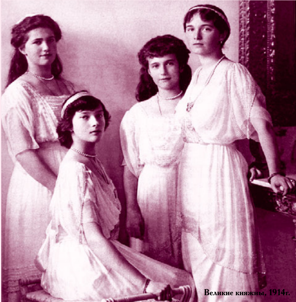
Великне княжны, 1914г.

Среди малоизвестных стихотворений С.Есенина есть одно, обращенное к царевнам, дочерям государя императора Николая II. В 1917 году С.Есенин служил санитаром в Царскосельском полевом военно-санитарном поезде №143, читал стихи в Царскосельском лазарете, где часто бывали императрица и её дочери. Поэт был поражён добротой души, заботой царевен, которые стремились облегчить участь раненых. 22 июля 1916 года С.Есенин был приглашен прочесть стихи Императрице Александре Феодоровне, Цесаревичу Александру и Великим Княжнам в Царском Селе. Поэт преподнес Великим Княжнам свое новое стихотворение «Младым царевнам», выписав его на большом листе ватмана славянской вязью и украсив орнаментом. После революции стихотворение попало под запрет и было опубликовано лишь в 1960 г. Можно только удивляться прозорливым предвидением С.Есенина трагической гибели «младших царевен», за которых он просил помолиться «святую Магдалину».