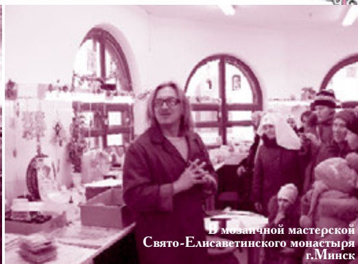
В мозаичной мастерской Свято-Елисаветинского монастыря г. Минск