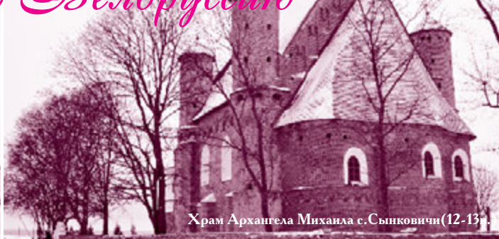
Храм Архангела Михаила с. Сынковичи (12-13 вв.)