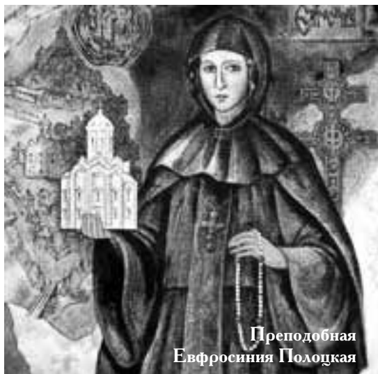
Преподобная Евфросиния Полоцкая

Регулярно участвуя в паломнических поездках, я понял, что паломничество укрепляет веру. Оно укрепляет в нас христианский дух, учит терпению, благодарности, побуждает к любви и состраданию к ближнему, учит с благоговением относиться к святыне, а также возрождает исторические корни. Домой возвращаешься другим человеком.