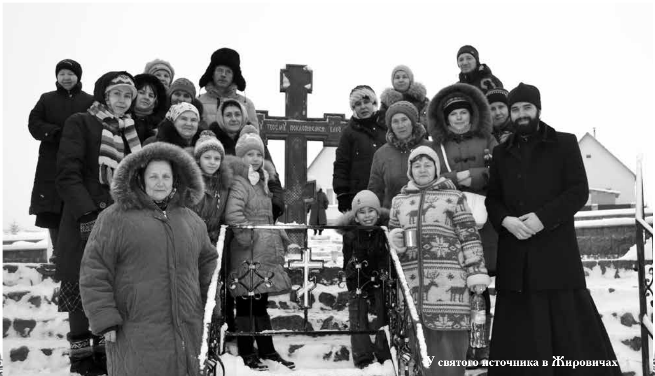
У святого источника в Жировичах

С любовью о Господе паломническая служба Александро-Невского храма