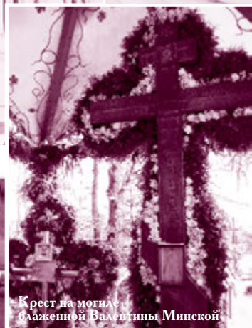
Крест на могиле блаженной Валентины Минской