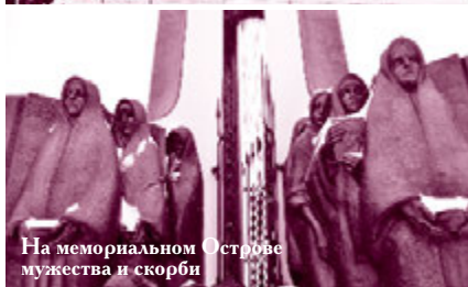
На мемориальном Острове мужества и скорби