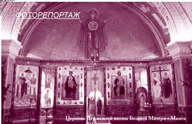
Церковь Государственной иконы Божией Матери г. Минск