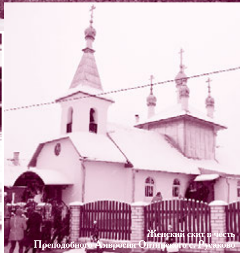
Женский скит в честь Преподобного Амвросия Оптинского с. Русаково