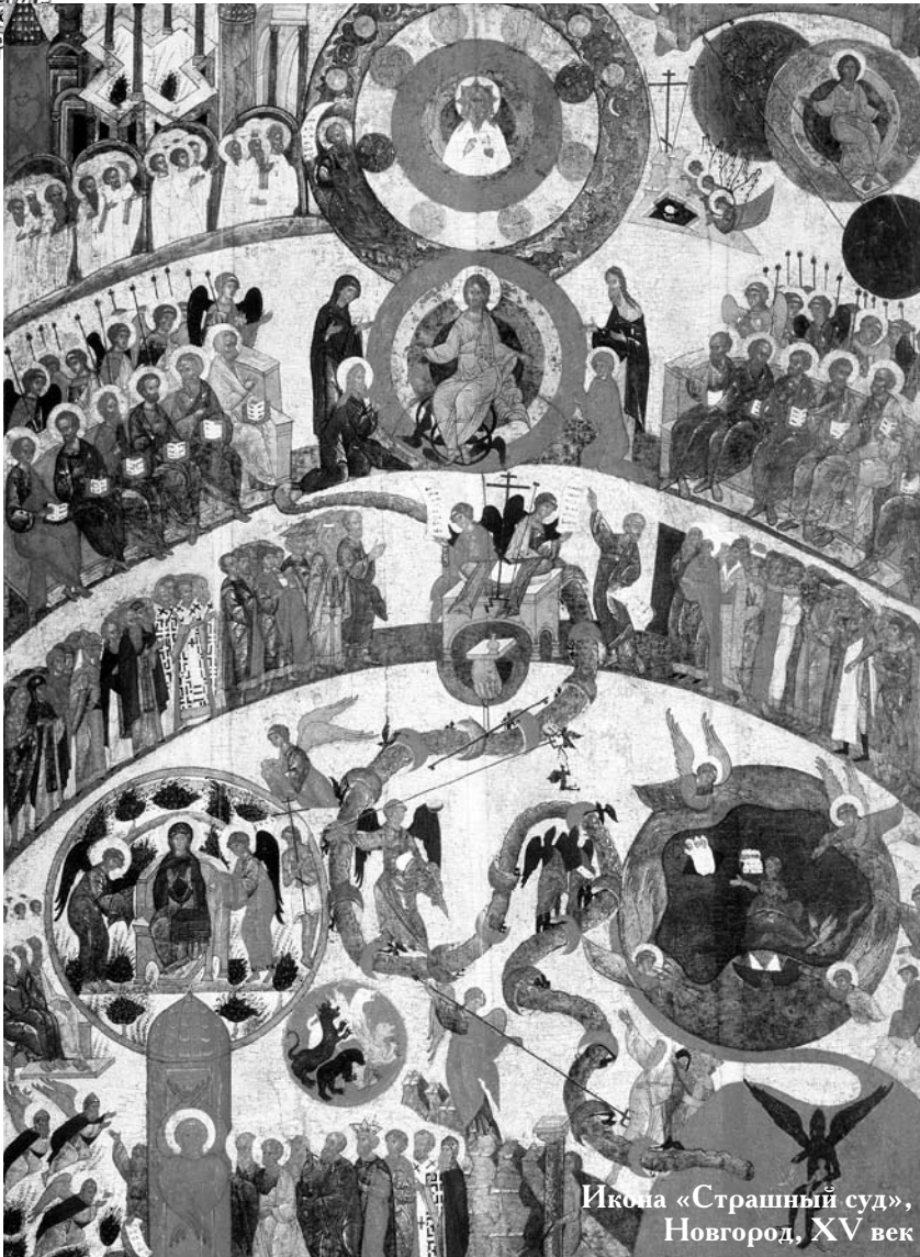
Икона «Страшный суд», Новгород, XV век

А постол Павел писал: человеку положено однажды умереть, а потом суд (Евр. 9:27). В своей заботе о спасении каждого Церковь и предлагает воспоминания об этом суде, чтобы спасти по крайней мере некоторых (1 Кор. 9:22).