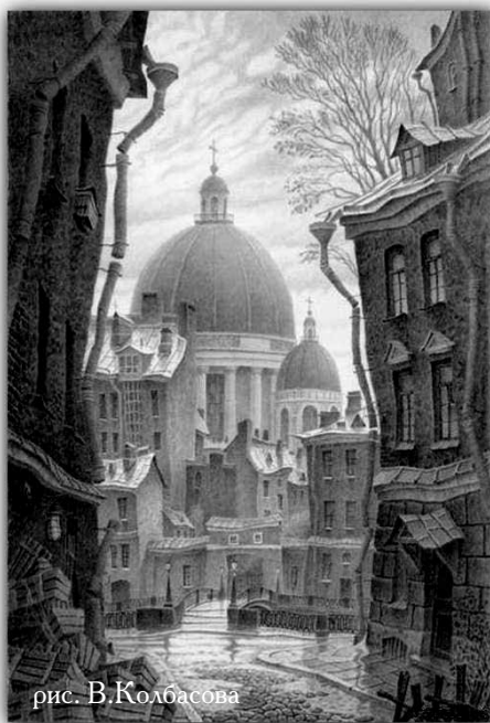
рис. В. Колбасова