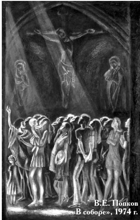
В.Е. Попков «В соборе», 1974 г.