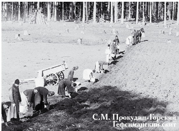
С.М. Прокудин-Горский Гефсиманский скит

но отец Павел перебил неожиданным вопросом: «Ты мне, вот что лучше скажи, стоит или не стоит в этом году картошку сажать? Может, я лучше тамбовской, привозной куплю? А что, она у них хорошая лёгкая».