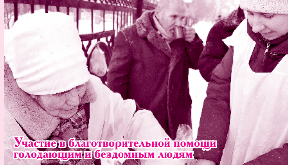
Участие в благотворительной помощи голодающим и бездомным людям