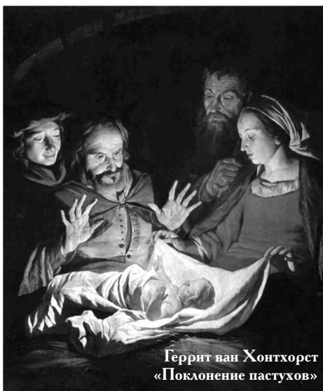
Геррит ван Хонторст «Поклонение пастухов»

Святой Кирилл Александрийский много размышлял над этим Божественным «кенозисом», над этим уничижением. «Бог — говорит он, — воплощаясь, не мог совлечь с Себя Своей природы, ибо тогда Он не был бы больше Богом, и нельзя было бы говорить о воплощении. А это значит, что субъектом кенозиса является не природа, а Личность Сына. Личность же «совершается» в отдаче Себя: она отличается от природы не для того, чтобы «превозноситься» естественным, а чтобы от Себя всецело отказаться; вот отчего Сын «не почитал хищением быть равным Богу», но, напротив, «Сам уничижил Себя», что является не внезапным решением, не единичным актом, но проявлением самого Его существа как Личности; и это также не собственная Его воля, а сама ипостасная Его реальность, как выражение воли троичной, той воли, источник которой — Отец, послушное исполнение которой — Сын, славное завершение — Дух. Итак, существует глубокая неразрывность между личностным бытием Сына, как самоотказом, и Его земным кенозисом. Оставляя пребывание в славе, которой Он никогда не «превозносился», Сын