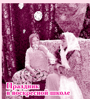
Праздник в воскресной школе