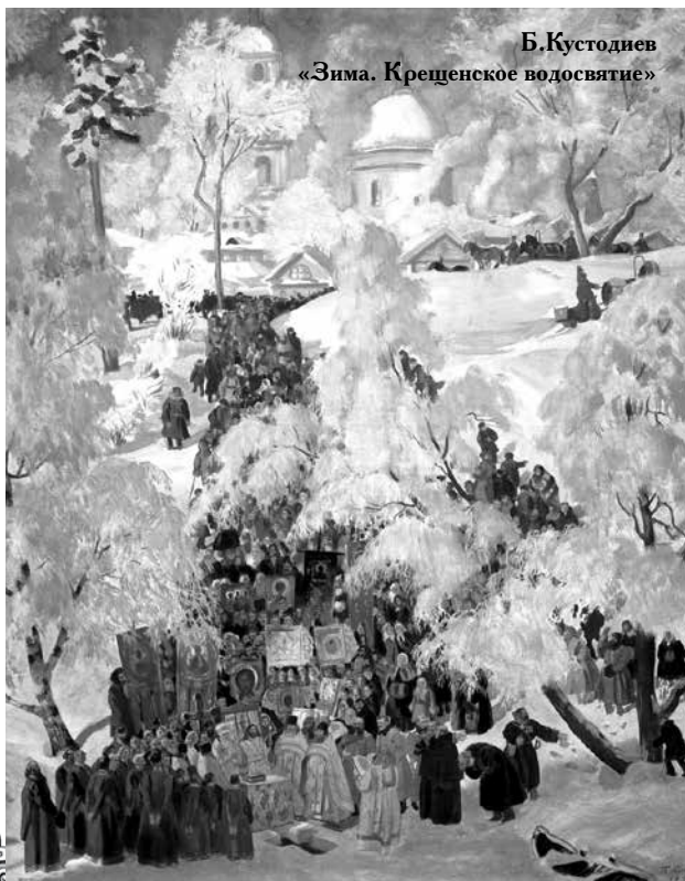
Б. Кустодиев «Зима. Крещенское водосвятие»